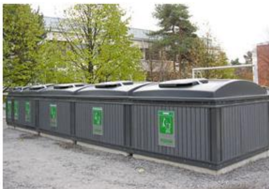
«Molok Domino Modulsystem»

http://www.strombergs-plast.no/produkter/molok-domino-modulsystem-avfall-bakken/